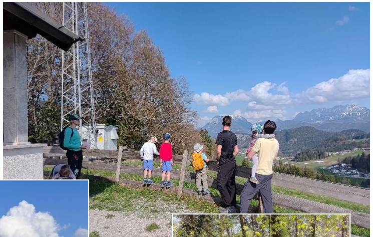
Wanderung auf den Kapellenberg mit Aussicht auf Haus Sonnleiten und den Wilden Kaiser.