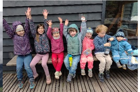
Wanderung auf den Thierberg, dort kann der Burgturm bestiegen werden