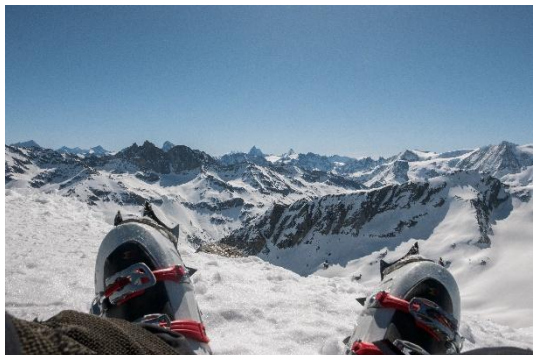
Haute Route

Unsere Mitglieder zeigen ausgewählte Bilder der ASC-Touren von 2025. Wenn Ihr einen Beitrag leisten wollt, bringt die Bilder am besten auf einem USB-Stick oder ähnlichen Datenträger an dem Abend mit.