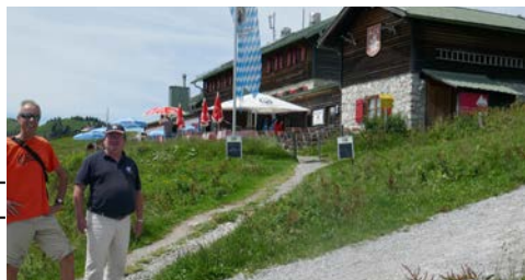
Stefan und Oli vor der Abstimmung zu Baumaßnahmen auf dem Brauneck-Gipfelhaus

E-Mail: erich.streicher@alpinerskiclub.de