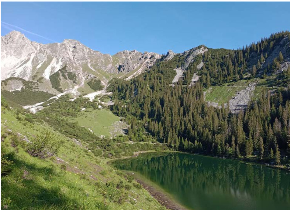
Blick ins Karwendel