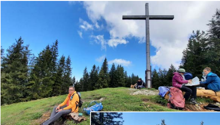
Fotos: Erich Streicher, die bei der Wanderung auf den Aufacker 2024 entstanden sind.

E-Mail: erich.streicher@alpinerskiclub.de