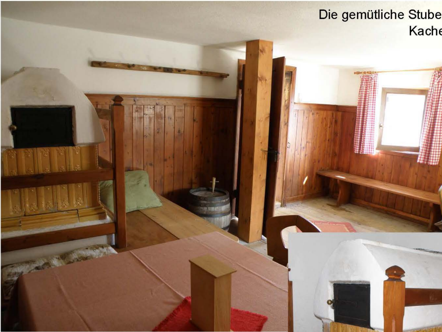
Die gemütliche Stube wird mit dem Kachelofen beheizt