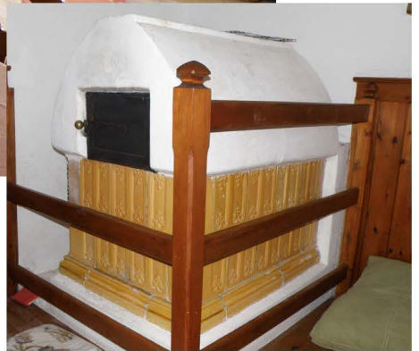
Und auch der Schlafraum kann beheizt werden.