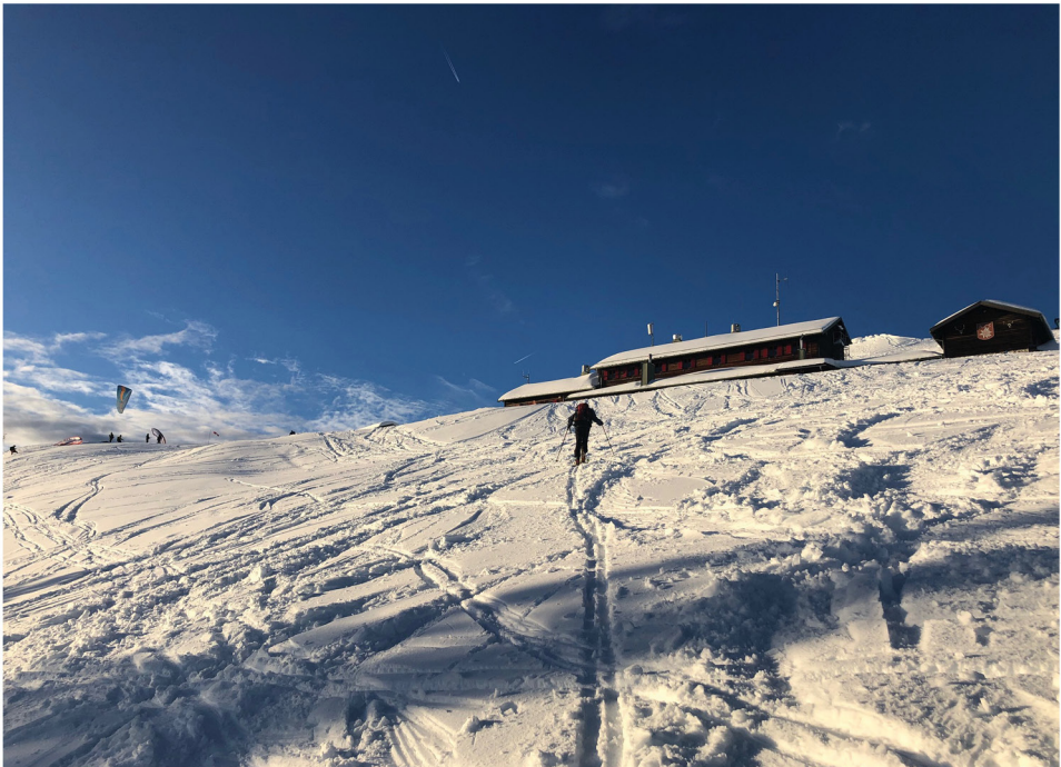
Auf dem Weg zum Brauneck-Gipfelhaus

GESCHÄFTSSTELLE: Feigstraße 9, 80999 München Telefon 089 / 76 75 58 52