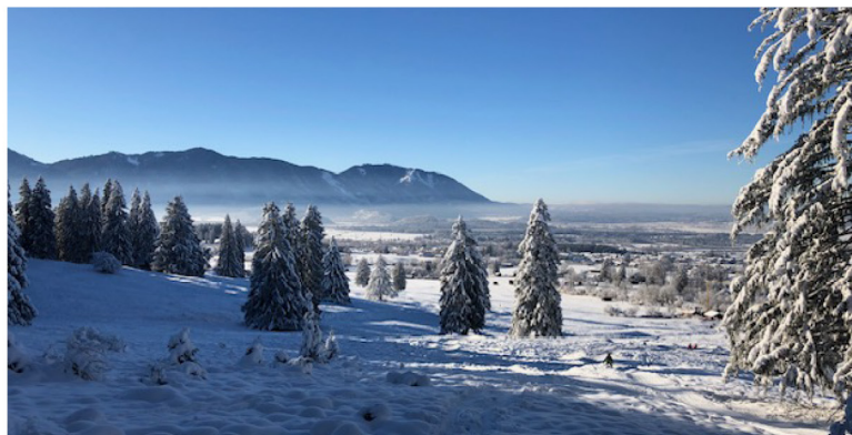
Blick auf Ohlstadt

Wie immer erfolgt die Einladung persönlich. Bitte beachtet, wenn Ihr eine E-Mail Adresse bei der Geschäftsstelle hinterlegt habt, kommt die Einladung nicht per Post, sondern als E-Mail!