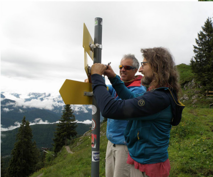
...und beim Anschrauben

und so sehen sie dann fertig aufgestellt aus.