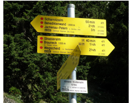
Die fertig montierten Schilder

AV451 Talstation - Probstalmsattel 8,0 km AV451A Achselköpfe 1,5 km AV466 Arzbach - Längental (2.Brücke) 4,1 km AV468 Arzbach - Längental/Jägersteig 6,8 km AV469 Talstation - Wasserboden - Brauneck 7,1 km AV471 Wegscheid - Bichler Alm 9,7 km AV473 Wegscheid - Brauneck 5,8 km AV475 Langeneck - Hinterkrottenalm 9,0 km AV477 Langeneck - Langenecksattel 10,1km